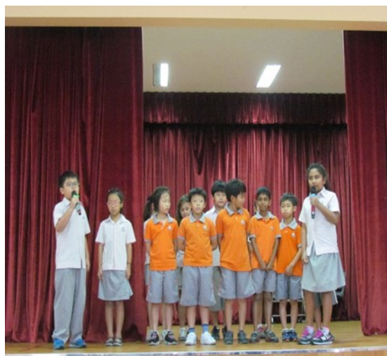
Học sinh biểu diễn trong buổi sinh hoạt