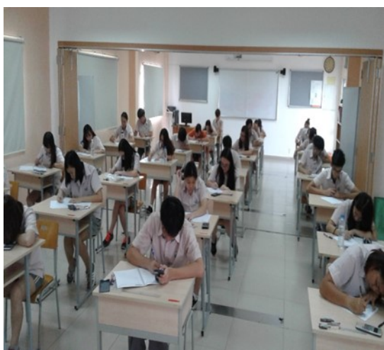
Kỳ thi Cambridge

Buổi diễn văn nghệ của các em học sinh từ lớp mầm non đến lớp 3 và từ lớp 4 trở lên. Chủ đề của buổi biểu diễn là "Hành trình qua văn học". Mỗi lớp đã chọn một câu chuyện, một cuốn sách và kết hợp nó với một bài hát. Một số lớp đã bắt đầu tập dợt, một số lớp khác sẽ tập dợt sau kỳ thi. Quý Phụ huynh có thể hỏi thêm con em mình về các hoạt động của các em. Nhiều thông tin về buổi biểu diễn sẽ được gửi tới Quý Phụ huynh.