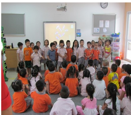
Học sinh khối mầm non