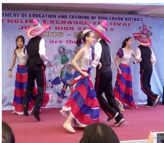
Học sinh lớp 6-7 Song ngữ giành giải 3 trong cuộc thi hóa trang

Kỳ thi lấy chứng chỉ trung học đại cương Quốc tế (IGCSE) và chứng chỉ Quốc tế Cambridge cấp độ AS và A Level đã bắt đầu! Thầy cô và các em học sinh đã làm việc rất chăm chỉ để đạt được kết quả tốt nhất. Đây là một trong những bước đầu tiên, là cơ hội cho các em học sinh có một tương lai tươi sáng và thành công trong học tập và sự nghiệp của các em. Chúng ta sẽ sớm nói lời tạm biệt với 3 em học sinh lớp A Level và 3 em học sinh lớp GAC sẽ sớm tốt nghiệp trong năm học này. Chúng tôi hy vọng rằng Quý Phụ huynh sẽ bớt chút thời gian tham gia buổi lễ tốt nghiệp tại khách sạn Crystal Palace, Quận 7 vào ngày 28 tháng Sáu. Đây chắc chắn sẽ là một buổi tối tuyệt vời. Quý Phụ huynh có thể mua vé tại văn phòng trường.