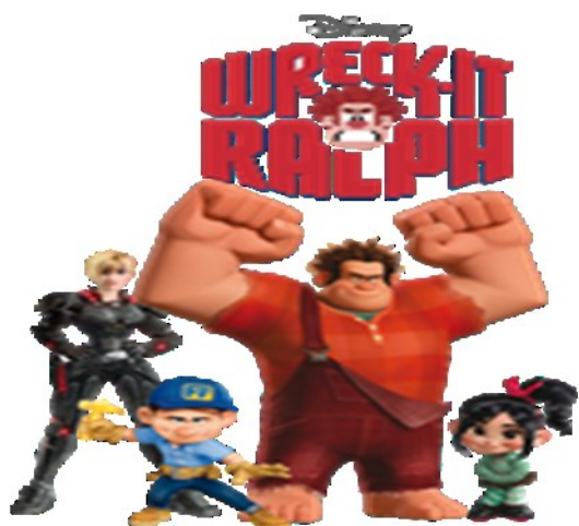
Bộ phim "Wreck-It-Ralph"