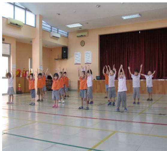
Học sinh tập dợt trước biểu diễn văn nghệ cuối năm