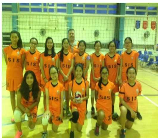
Đội bóng chuyền nữ U14