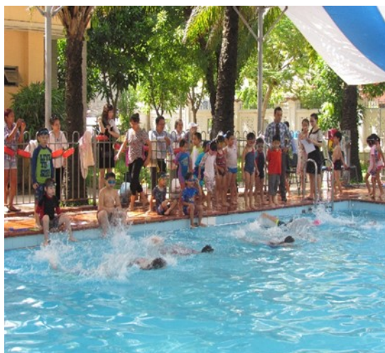
Hội thi bơi