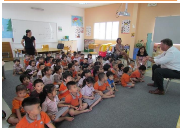
Giờ sinh hoạt chung của các em học sinh Mẫu giáo