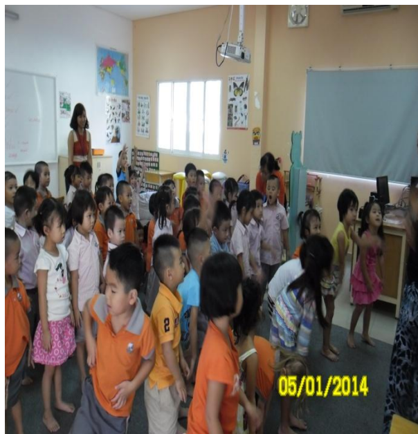
Cùng nhảy nào!