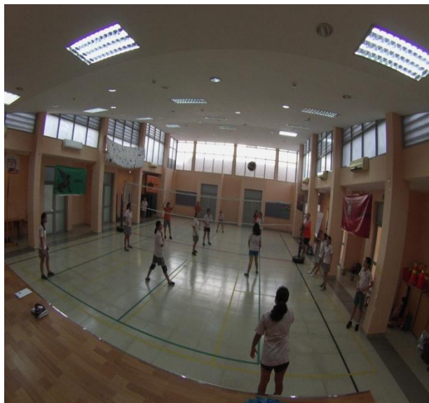
Đội tuyển bóng chày nữ dưới 19 tuổi

Bóng chày là một môn thi đấu tương đối mới, được bắt đầu tại trường chỉ hơn hai năm trước, nhưng sự tiến bộ của tất cả các vận động viên thật tuyệt vời. Đội đã đi từ một nhóm nhỏ các cô gái đến một nhóm lớn bao gồm các chàng trai và cô gái tham gia. Tất cả các cầu thủ đã hoàn thành việc tập luyện trong hai năm qua và tôi tự hào về mỗi vận động viên. Năm nay, tất cả các cô gái trong đội dưới 19 tuổi đã được đền đáp cho những khổ luyện của các em. Vào ngày 12/11, Trường Quốc tế Nam Sài Gòn (SSIS) đã đăng cai tổ chức giải vô địch Các trường Quốc tế tại TP.HCM. Các cô gái của chúng ta đã chơi ba trận đấu vất vả để gặp đội Trường Quốc tế SSIS trong trận chung kết. Lần đầu tiên trong lịch sử Trường Quốc tế Singapore, một đội bóng chày của trường có mặt trong trận chung kết của giải, các cô gái đã giành vị trí thứ 2. Các em đã chơi tốt và cho thấy tinh thần thể thao tuyệt vời trong suốt mùa giải. Tôi mong muốn được huấn luyện các cô gái đội dưới 19 tuổi trong năm tới khi chúng tôi đặt mục tiêu giành chức vô địch. Chúc mừng tất cả các cô gái đội dưới 19 tuổi cho chiến thắng lịch sử của các em và cho Trường Quốc tế Singapore!